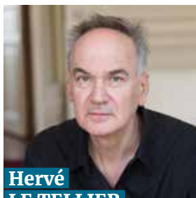
Hervé LE TELLIER